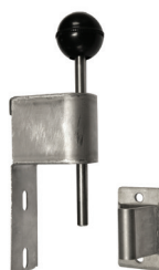
Barnstuge Rox lås