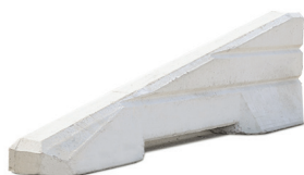
STARTDEL & SLUTDEL