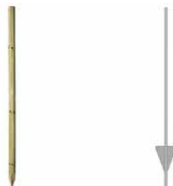
Trestolper eller vingstolper