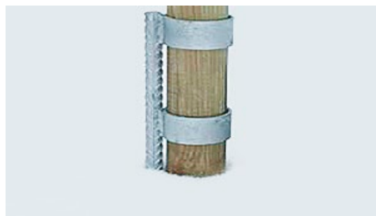
Puu- tai pyöreät teräspylväät